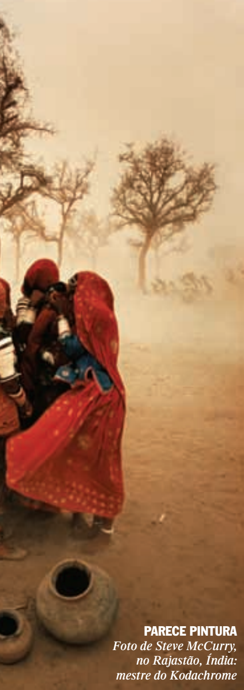
PARECE PINTURA Foto de Steve McCurry, no Rajastão, Índia: mestre do Kodachrome